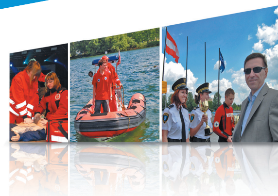
Inteligentny System Sterowania Ruchem (ITS)

System ITS będzie obejmował ulice: Witosa, Płoskiego, Wilczyńskiego, Kalinowskiego, Warszawską, Armii Krajowej, Sielską, Schumana, Bałtycką, Artyleryjską, Wojska Polskiego, Sybiraków, Jagiellońską, Limanowskiego, Bema, Partyzantów, Lubelską, Budowlaną, Towarową, Leonharda, Wyszyńskiego, Pstrowskiego, Synów Pułku, Krasickiego.